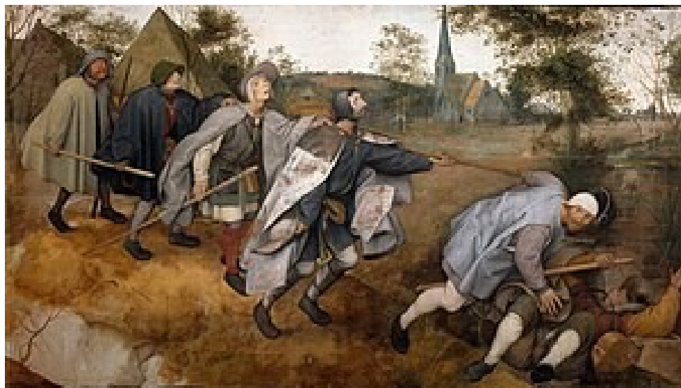
Figura 5 Pieter Bruegel, La parabola dei ciechi, 1568