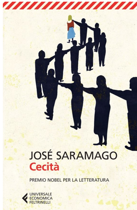
Figura 4 Copertina per l'ultima edizione di Saramago (verosimilmente ispirata al quadro di Bruegel)