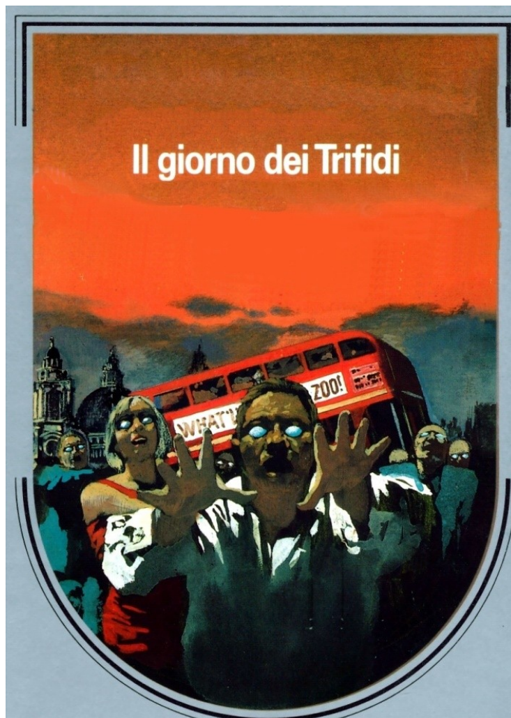
Figura 1 Il giorno dei Trifidi, ill. di Karel Thole