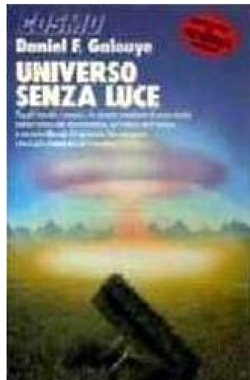
Figura 3 Copertine originali per Dark Universe