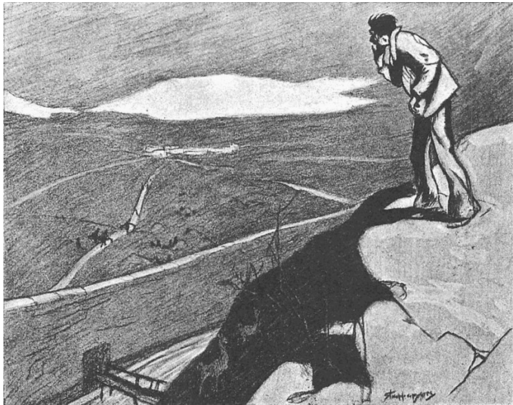
Figura 2 In the country of the blind, ill. originale da The Strand Magazine