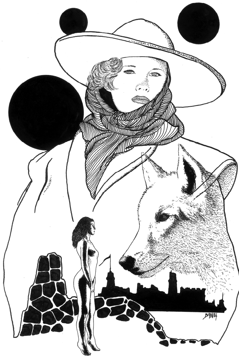
Disegno riprodotto per gentile concessione dell'artista Alessandro Bani